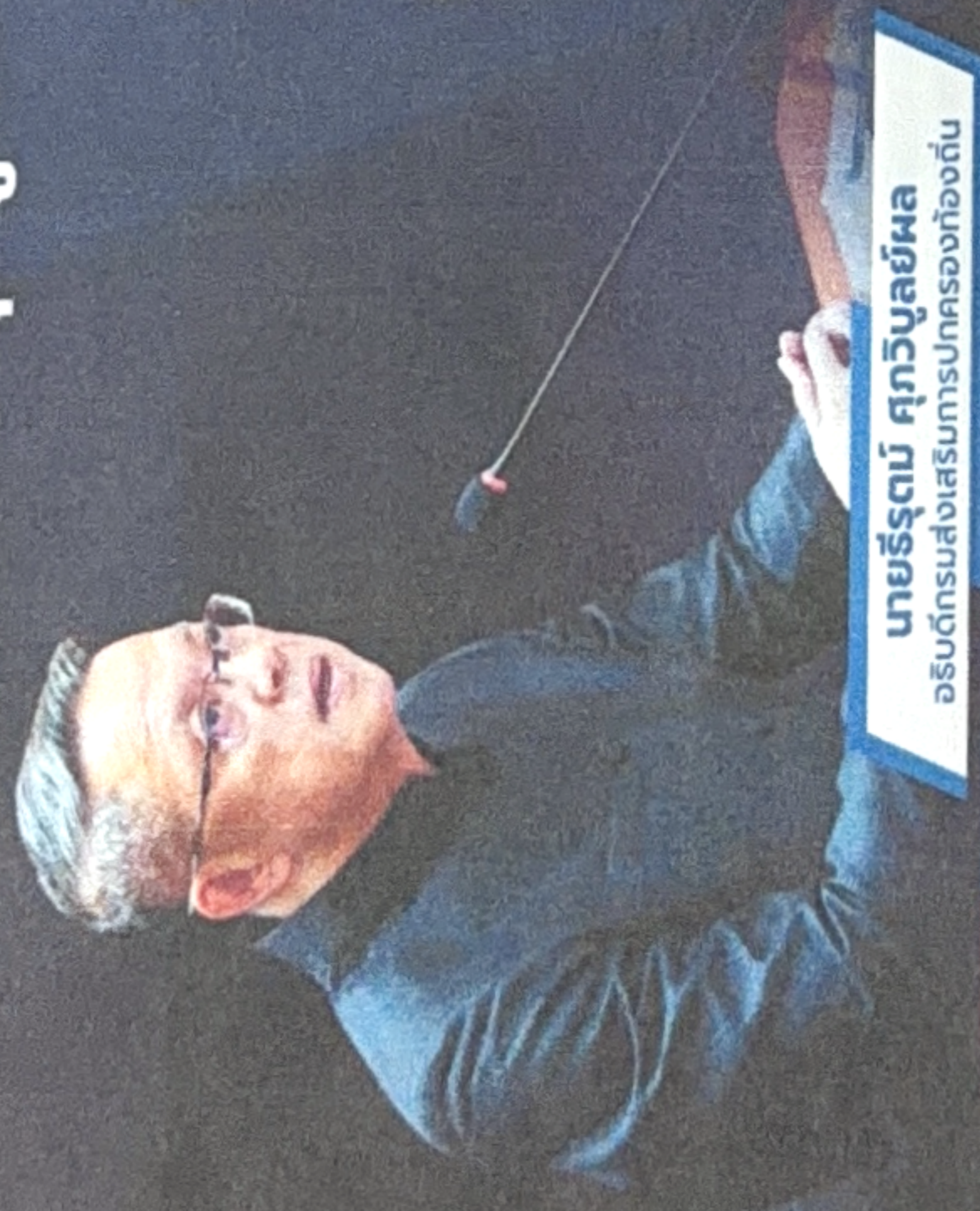
นายรัฐณ์ สุภวิบูลย์ผล อธิบดีกรมส่งเสริมการปกครองท้องถิ่น